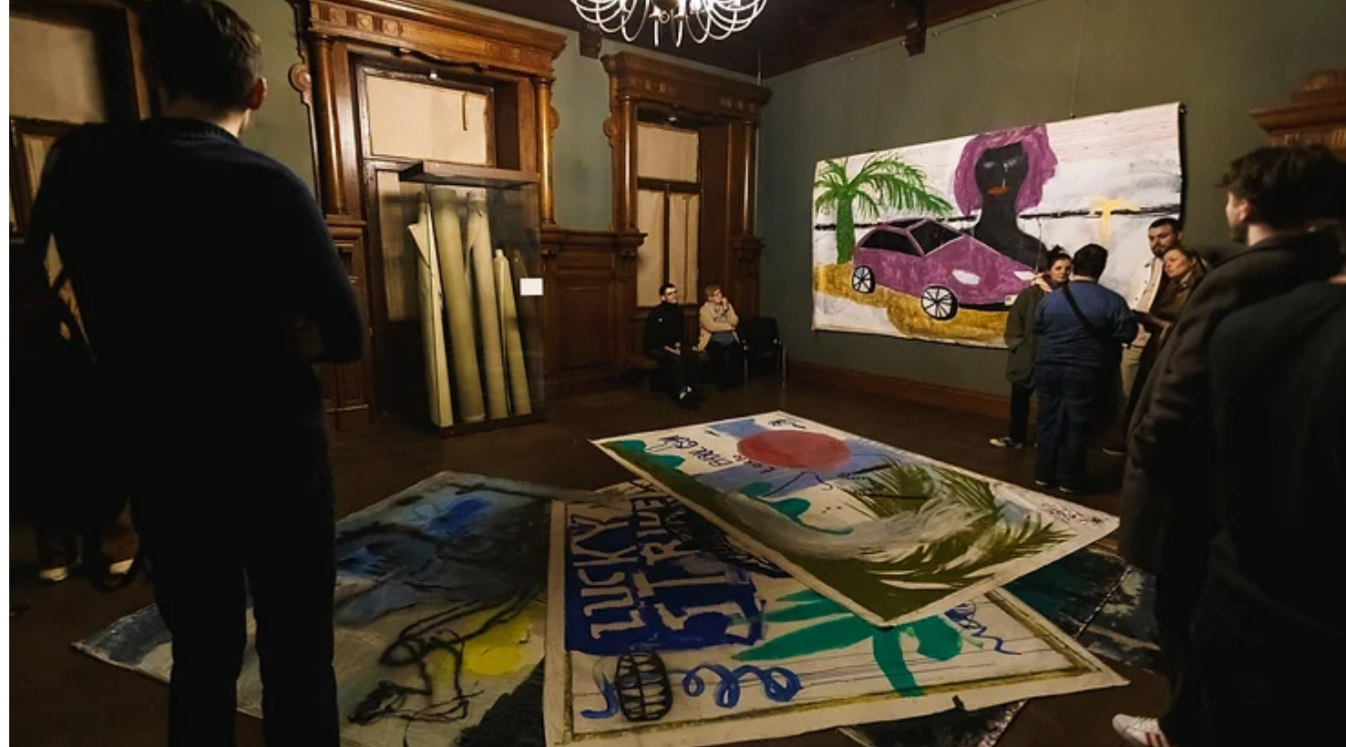
фрагмент експозиції проекту "Тим Часом в Домі Ханенків" в київському музеї Ханенків