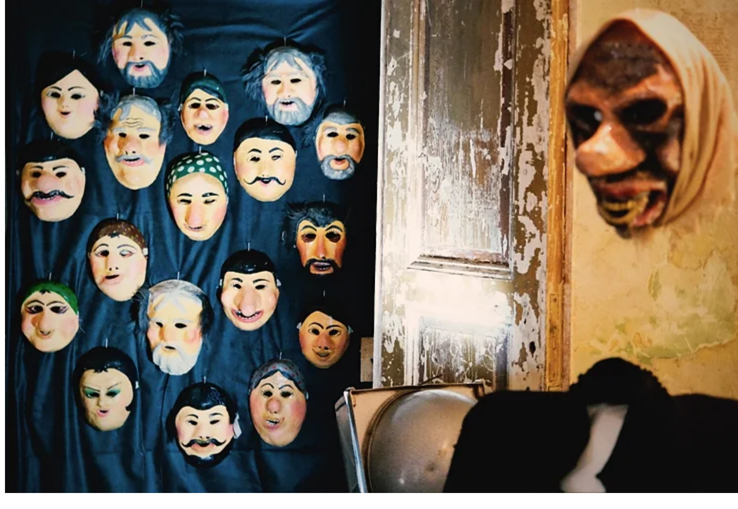
фрагмент експозиції виставки "Памфірова Маланка. Кінолабораторія" у Львівському муніципальному мистецькому центрі, фото — Львівський муніципальний мистецький центр

Проект у Львівському муніципальному мистецькому центрі — тільки фрагмент великої виставки, яка була представлена в Українському Домі в Києві, але і він допомагає зазирнути за лаштунки роботи над фільмом та побачити, як працювали режисер, оператор і художники над створенням кіно. І як до цієї магії кіно вони залучили ще й магію народного карнавалу Маланки.